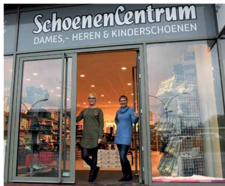
Van Hogendorpstraat 941 - 3135 BK Vlaardingen - Telefoon 010-4705925